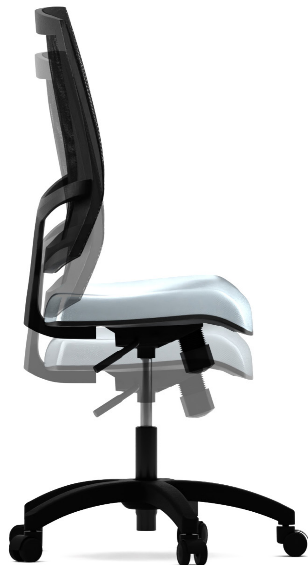
Graduación de altura