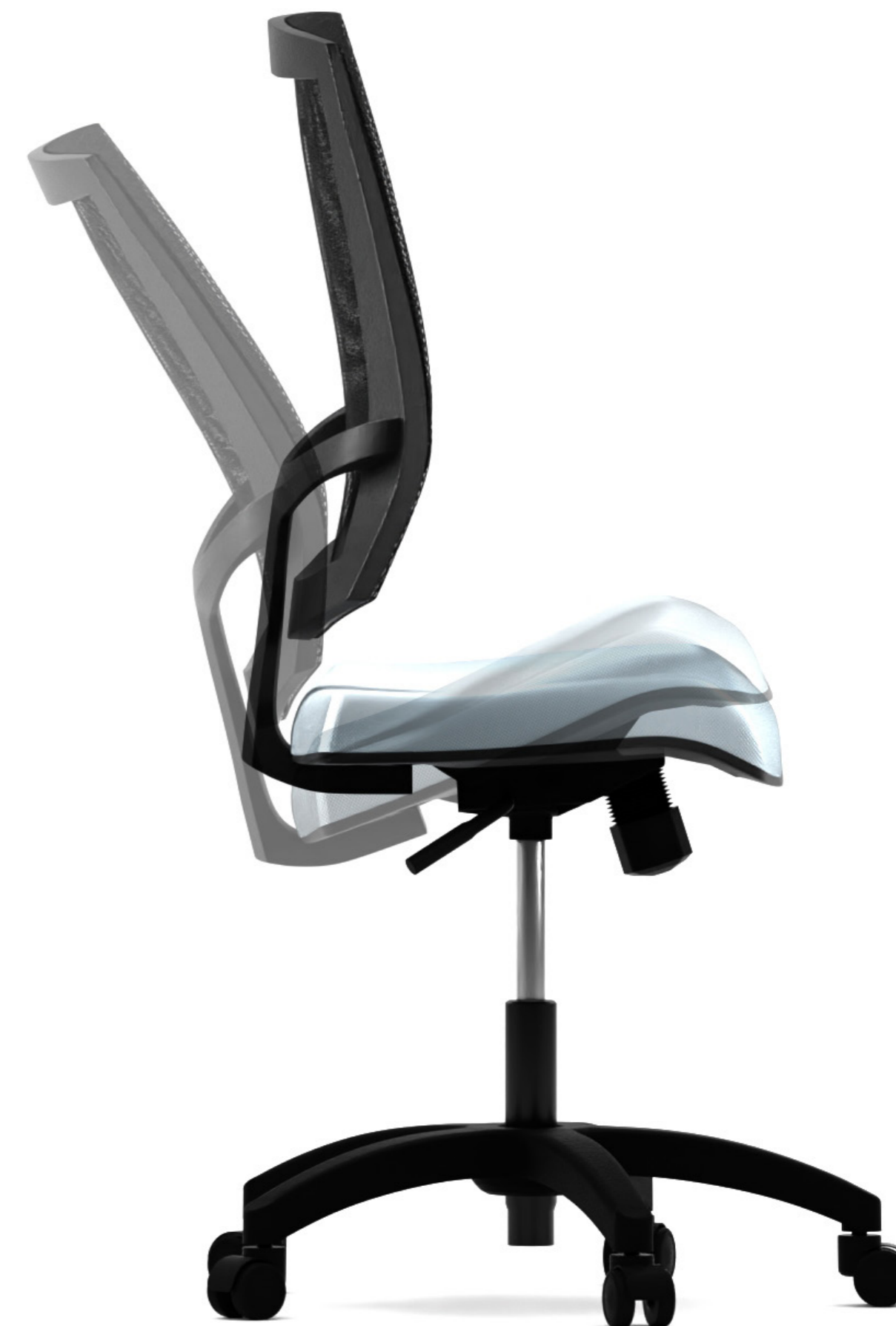
Ajuste de inclinación