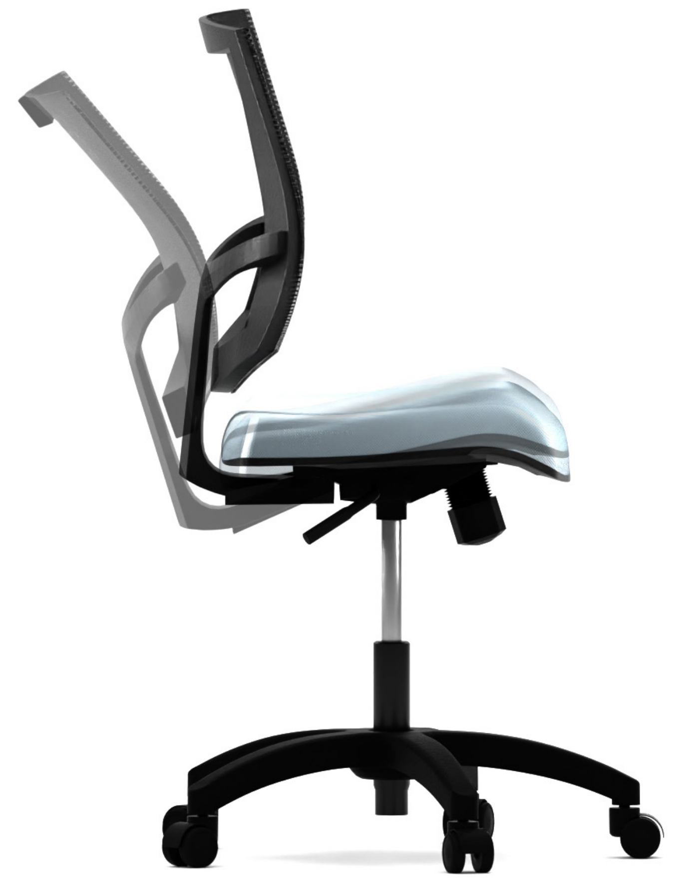
Ajuste de inclinación