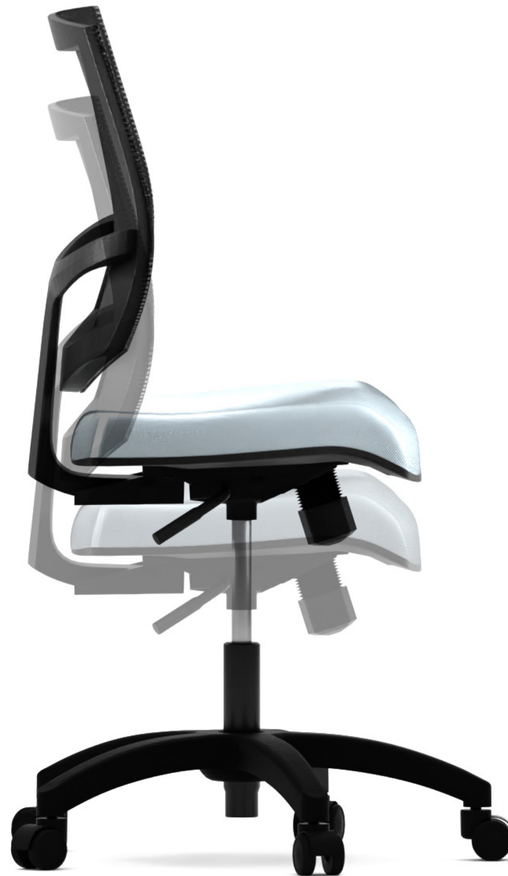
Graduación de altura